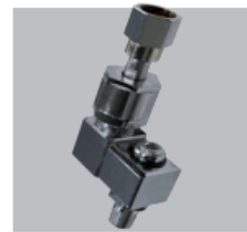
Dispositivo de engate universal (aço inoxidável)