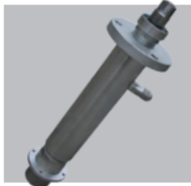
Bomba bicomponente branco

Peças de reposição a pronta entrega universais que atendem os seguintes equipamentos Glasil JMT 03 06 e 08 e Handok