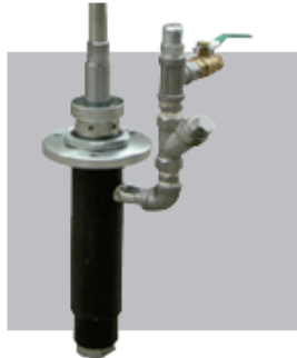
Bomba bicomponente preto