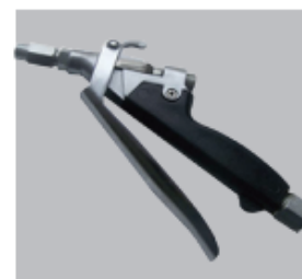
Pistola de aplicação uso horizontal e < até 45%