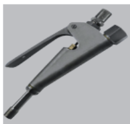
Pistola de aplicação Uso vertical