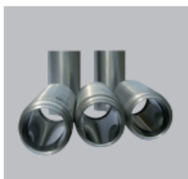
Camisa do cilindro da bomba aço forjado