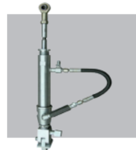
Bomba dosagem bicomponente