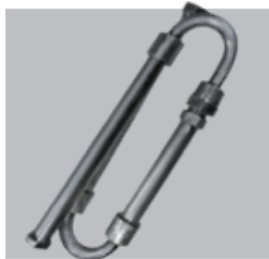
Mixer bicomponente aço inoxidável